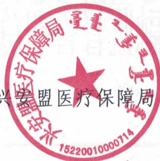
兴安盟医疗保障局